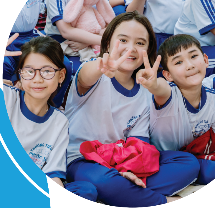
Học sinh khối 4 Tiểu học Phước Hải 3, Khánh Hòa

“Em mong chương trình sẽ có nhiều chủ đề hay và hấp dẫn hơn nữa!”